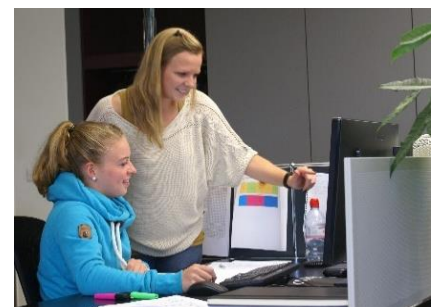
Unsere Lernenden bei der Arbeit