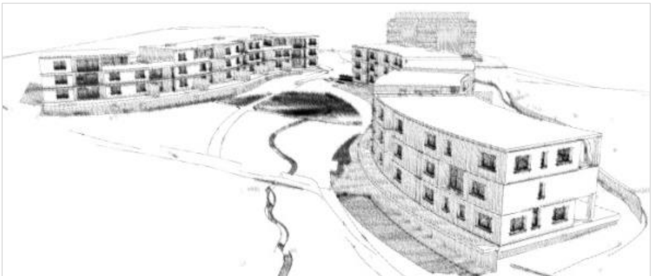
Visualisierung mit dem CAD-Programm ArchiCAD

Der Kunde steht bei uns im Mittelpunkt. Wir bieten ihm optimale Beratung, Planung und Ausführung und sind in jeder Projektphase ein kompetenter und zuverlässiger Partner. Unser höchstes Ziel ist der zufriedene Kunde, der seine baulichen Wünsche und Vorstellungen in dem von uns realisierten Gebäude wiederfindet.