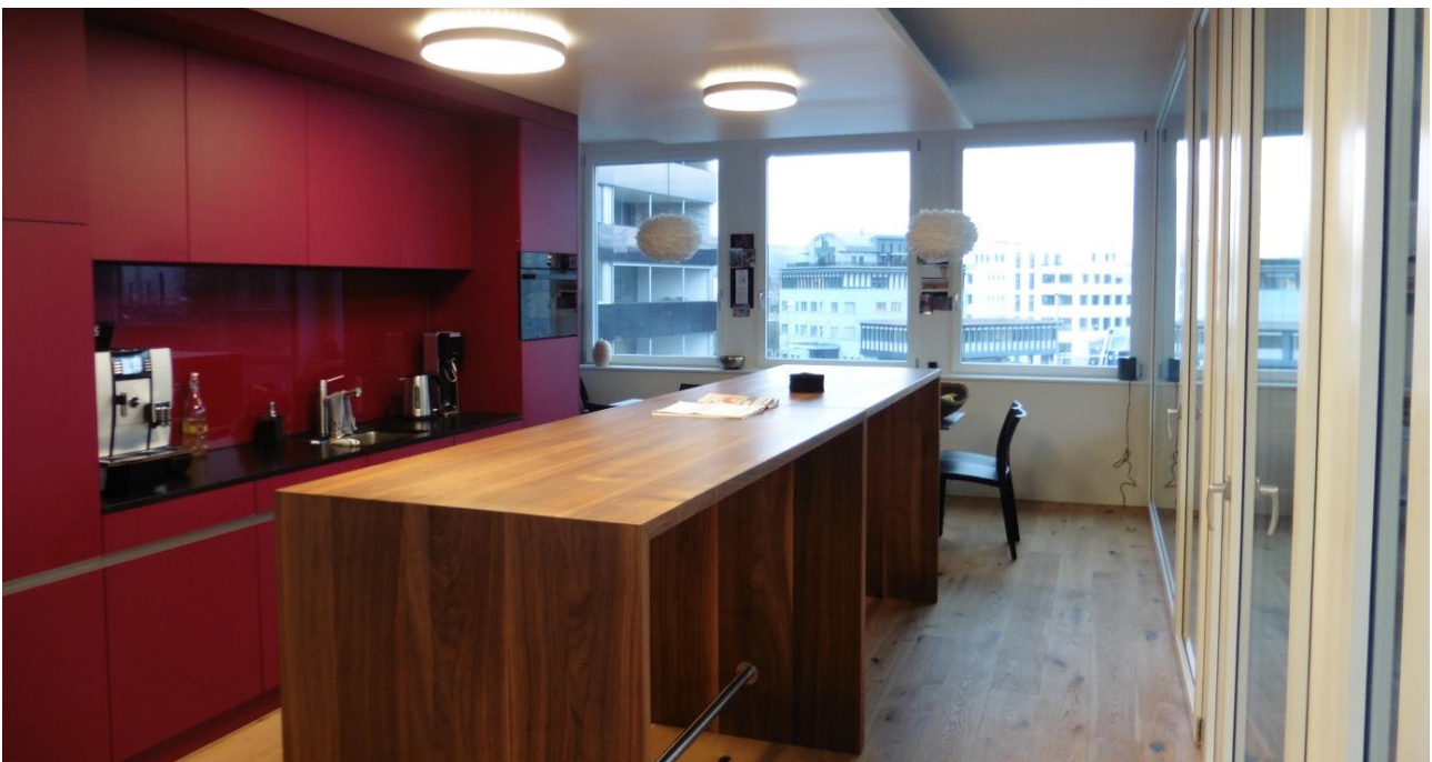
Pausenraum in Sursee